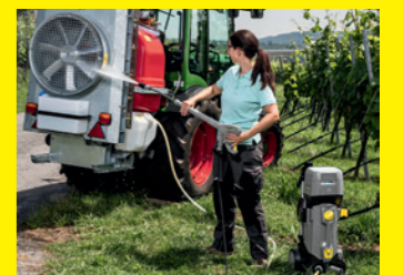
Akku-Feldspritzenreiniger HD 4/11 C Bp Pack Plus Farmer