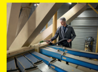
Silo-Sauger IVM 40/24-2H ACD Adv Farmer