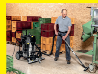
Multifunktions-Flächensauger NT 75/2 Tact² Adv Farmer