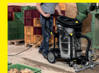
Multifunktions-Flächensauger NT 75/2 Tact² Adv Farmer